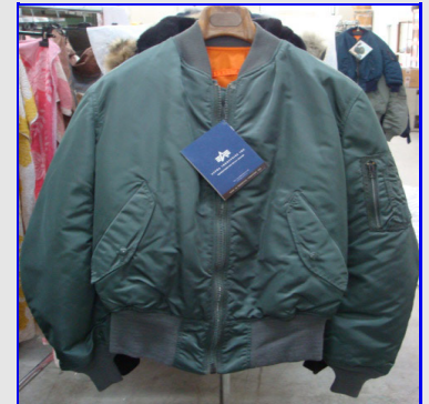
MA-1 Flock Made in USA